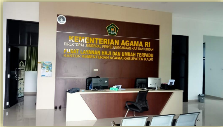
Gambar 3.2 Gedung PLHUT Kabupaten Kaur

Dengan telah dibangunnya 2 PLHUT pada tahun 2023, maka saat ini Kanwil Kemenag Provinsi Bengkulu telah memiliki PLHUT di 5 Kabupaten dan 1 Kota, dan berharap dalam beberapa tahun kedepan seluruh Kabupaten dan Kota di Provinsi Bengkulu telah memiliki fasilitas PLHUT sebagai komitmen peningkatan layanan ibadah haji.