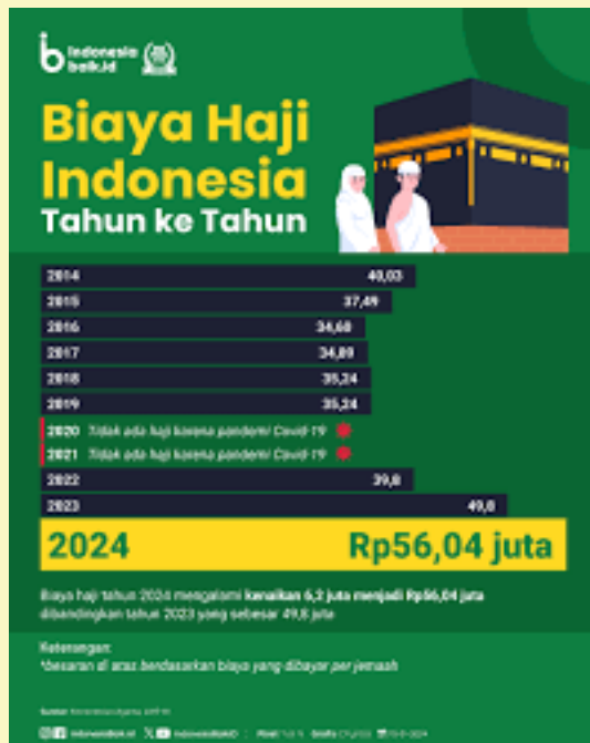
Gambar 3.5 Besaran Biaya Haji dalam 10 Tahun terakhir