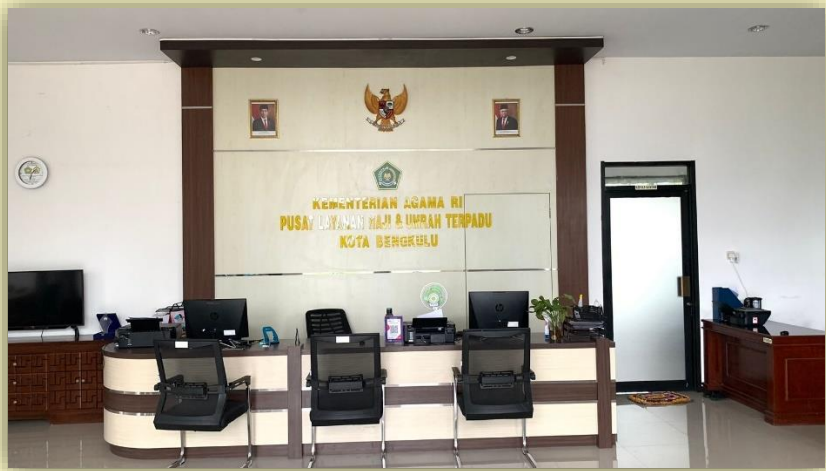
Gambar 3.1 Gedung PLHUT Kota Bengkulu