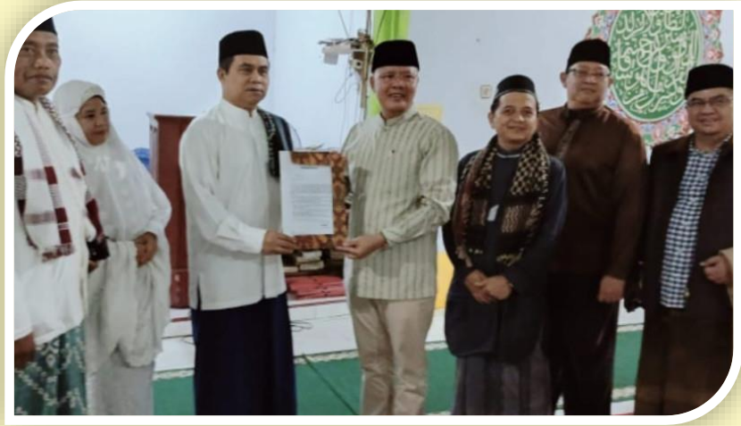
Gambar 3.3 Kepala Kemenag Kepahiang Terima Hibah Lahan Pembangunan PLHUT dari Pemerintah Daerah

Selain pembangunan PLHUT di pada tingkat Kabupaten dan Kota, Untuk meningkatkan kualitas layanan penyelenggaraan haji dan umrah Kantor Wilayah Kementerian Agama Provinsi Bengkulu juga meningkatkan sarana diantaranya merevitalisasi asrama haji, sampai saat ini Bengkulu telah memiliki asrama haji setara hotel berbintang yang mulai dibangun menggunakan dana SBSN pada tahun 2016 lalu.