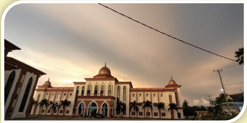
Gambar 3.4 Gedung Asrama Haji Bengkulu

Selanjutnya untuk meraih kemabruran haji dan umrah, selain persiapan yang terkait dengan bangunan penunjang, kesehatan, keamanan dan biaya, jemaah haji juga harus memiliki kesiapan ilmu manasik. Namun kenyataannya, tingkat pemahaman ilmu manasik jemaah sangat beragam disebabkan perbedaan tingkat pendidikan, pemahaman ilmu agama, usia, budaya, karakter dan budaya masyarakat.