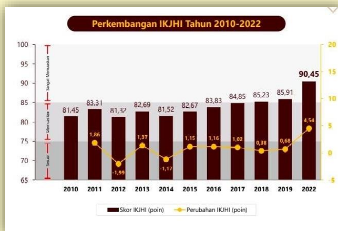
Grafik 3.2 Perkembangan Indeks Kepuasan Jemaah Haji Indonesia Sejak 2010 hingga tahun 2022

Nilai IKJHI sebesar 90,45 menunjukkan pelayanan penyelenggaraan ibadah haji Tahun 2022 “sangat memuaskan”. Tingkat kepuasan jemaah haji Indonesia tertinggi dicapai oleh daerah kerja/satuan operasi Makkah, dengan nilai indeks sebesar 91,57. Kenaikan nilai IKJHI terbesar dibandingkan Tahun 2019 adalah daerah kerja/satuan operasi Armuzna, naik sebesar 7,06 poin. Jenis layanan dengan nilai IKJHI tertinggi adalah pelayanan transportasi bus antarkota, dengan nilai indeks sebesar 91,93.